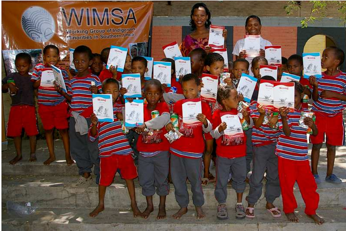
San börn með nýja námsefnið á !Kung tungumáli

Athyglisvert er að 96% af þessum tungumálum eru töluð af aðeins 4% jarðarbúa. Margar viðvörunarbjöllur hringja við glötun tungumála með vísan í menningarlega fjölbreytni í heiminum enda er því oft haldið því fram að hverfi tungumál glatist jafnframt menningin sem er samofin málinu. Þessi þróun tengist enn frekar varðveislu líffræðilegrar fjölbreytni því hefðbundin þekking á staðbundnu vistkerfi er varðveitt í svæðisbundnum tungumálum á umræddum slóðum. Frú Vigdís Finnbogadóttir hefur frá 1998 verið velgjörðarsendiherra tungumála hjá UNESCO og hefur í því hlutverki vakið athygli á mikilvægi tungumála fyrir menningarlega fjölbreytni og mikilvægi þess að standa vörð um tungumál sem eru í útrýmingarhættu.