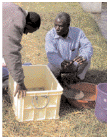
Vinna við fiskeldi.