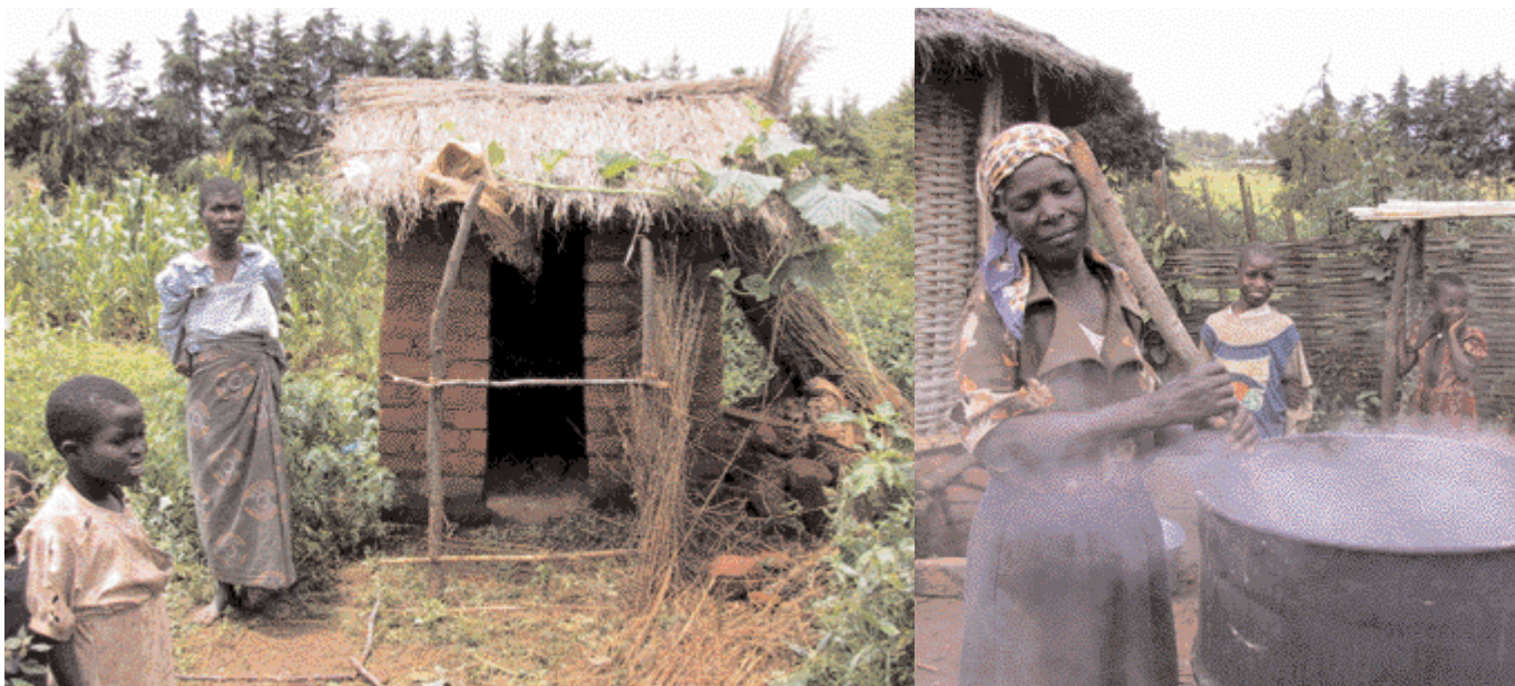
Vinnudagur kvenna er langur og oft strangur í fátækustu ríkjum Afríku.