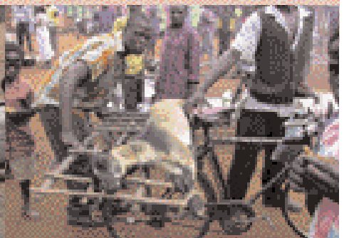
Í Afríku er að finna allar gerðir farartækja, allt frá rándýrum flutningabílum til reiðhjólans og uxakerrunnar. Ljósmyndir með greininni eru frá Malaví.