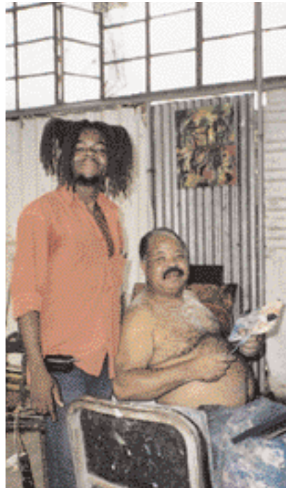
Listamennirnir Viler og Mucavele í listagalleríinu - Nucleo de Arte í Mapútó.