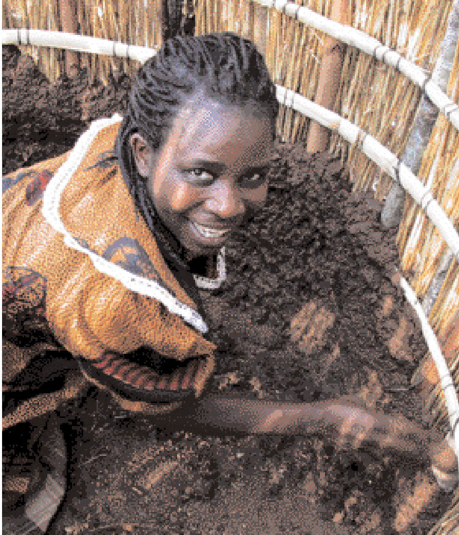
Byggingarvinna á landsbyggðinni. Ljós.: Gunnhildur Sveinsdóttir