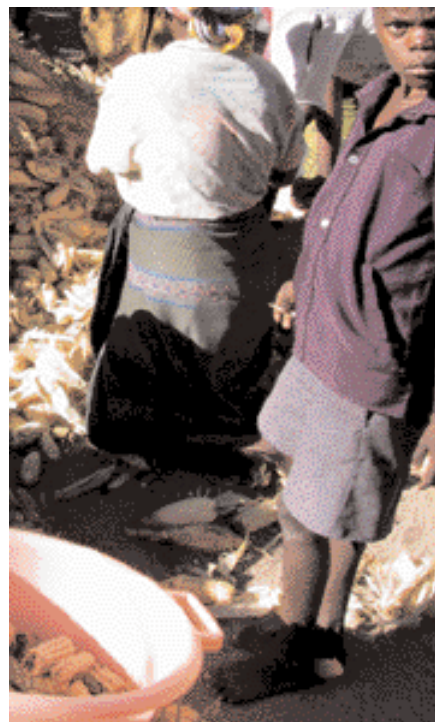
Á máisakrinum.

Frá verkefnum til geirastuðnings og samþættingar