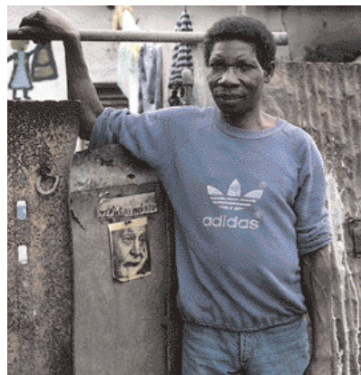
Nágrannarnir við Fiskimannastíg.