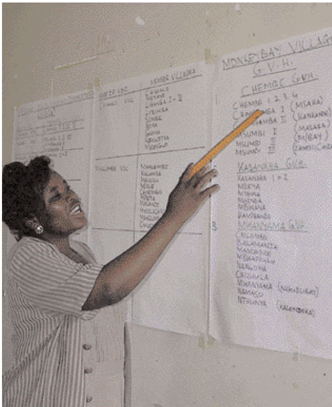
Phalees við kennslu.