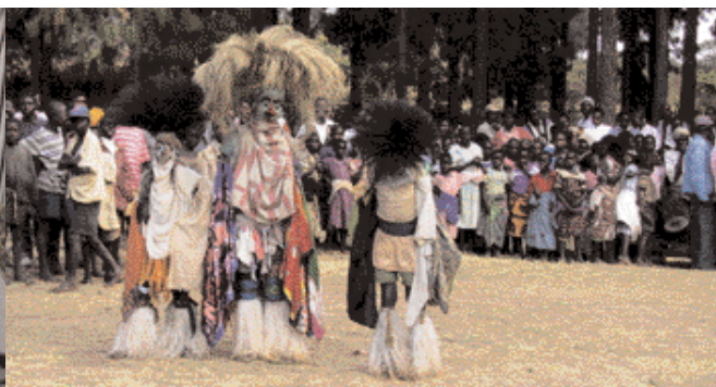
Við hátíðarhöld eru dansaðir fornir dansar.

annað en að fyllast aðdáun á þreki hennar! Maðurinn á dráttarvélinni í miðbæ höfuðborgarinnar, klæddur í jakkaföt og lakk-skó, er önnur mynd sem við fyrstu sýn vekur dálitla kátínu!