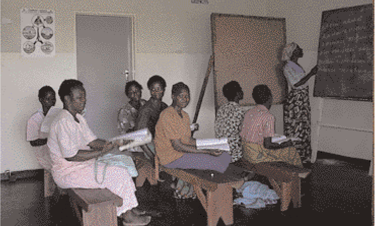
Kennslustund í fullorðinsfræðslubekk í Apaflóa.

hið líflega viðskipta- og atvinnuumhverfi svæðisins. Þó nokkuð hafi dregið úr þessum búferlaflutningum á undanförunum áratugum er stöðugur straumur fólks til og frá fiskiþorpunum enn þann dag í dag eitt helsta einkenni samfélaganna við Apaflóa.