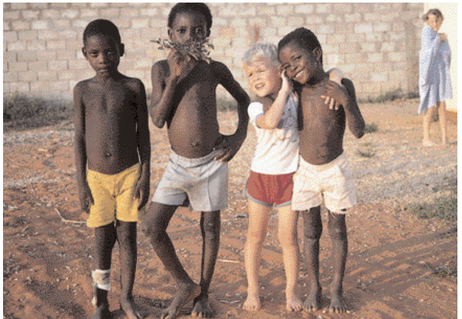
Börn í fiskimannaþorpinu Kakúakú.

Þegar við komum í frí til Íslands man ég að margir spurðu þabba að því hvort þeir nenntu nokkuð að vinna þessir negrar eða hvort nokkuð væri hægt að kenna þeim.