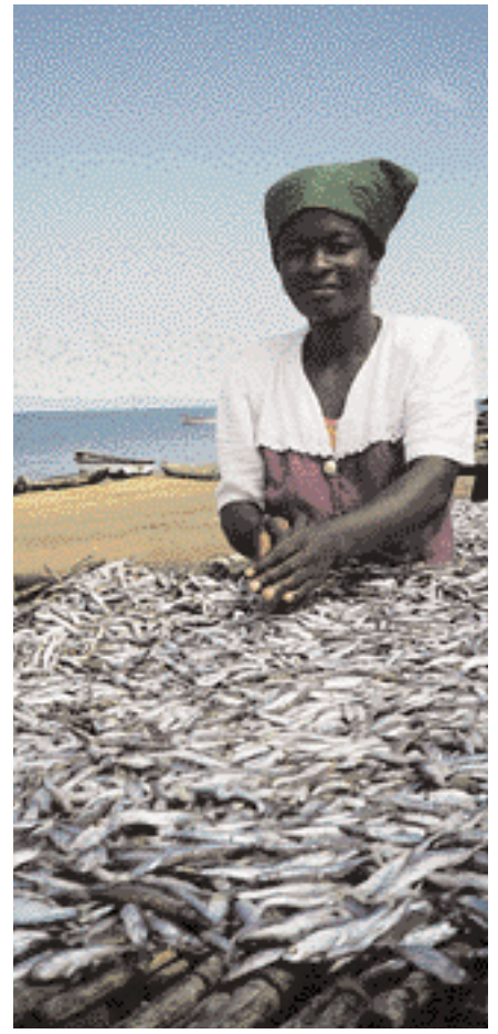
Fiskverkun við Malavívatn.

um við þessa aðferð. Meðal þess sem nefna má er að ákveðnar forsendur þurfa að vera fyrir hendi á hverjum stað til að ná fram samþættingu, svo sem nægur pólitískur vilji og opinber stefnumótun, mannaúður og vel skipulagðar stofnanir og loks þátttaka ólíkra hópa í opinberri ákvarðanatöku. Í mörgum þróunarlöndum skortir á að slíkar forsendur séu fyrir hendi. Þá getur verið harla erfitt að meta árangurinn þar sem oft á tíðum skortir fullnægjandi aðferðir til að greina áhrif þróunaraðgerða á kerfisbundinn hátt. Til dæmis eru ekki alltaf til staðar nægar upplýsingar og rannsóknir til að vinna út frá. Þá er ákveðin hætta á að þessari aðferð fylgi áhersla á ferli og aðferðir umfram sjálf markmiðin. Þannig getur verið auðveldara að sökkva sér niður í mismunandi atriði er varða framangsmáta og aðferðafræði í þróunarstarfinu fremur en að gera sér ljósa grein fyrir því að hverju samþættingin eiginlega beinist. Að lokum verður að nefna að enn er verið að berjast við draug sem lengi hefur fylgt þessari umræðu, þ.e.a.s. að forsendur þróunaraðstoðar, hugtakanotkun og vinnuaðferðir verði til í búðum þeirra sem veita aðstoðina en ekki þeirra sem þiggja hana. Þeir síðarnefndu verði einfaldlega alltaf að laga sig að breyttri orðræðu og aðferðafræði.