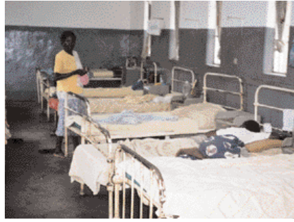
Frá heilsugæslustöð í Malaví.