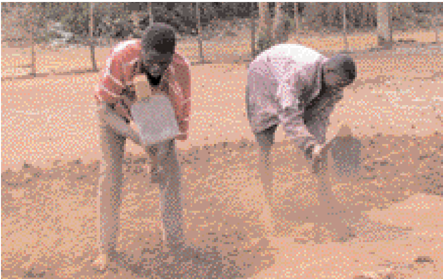
Stærstur hluti Malavíubúa lifa á landbúnaði.