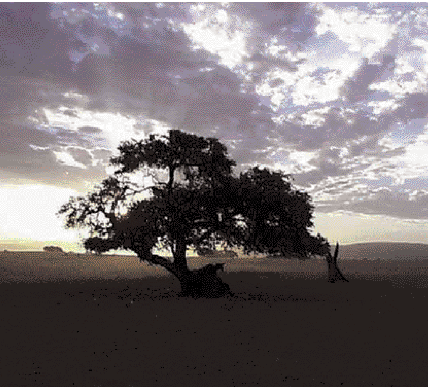
Langir skuggar um sólsetur.

Árstíðir í Namibíu eru öndverðar þeim á Íslandi og það var vetur þegar við komum hingað og nætur kaldar. Hús eru ekki kynt og þar af leiðir að þau eru köld og við þurfum að hita upp með rafmagnsöfnum. Á daginn er sól og hiti og gjarnan vindur seinni part dags hér við ströndina. Það var orðið alveg dimmt klukkan sex á kvöldin á þeim tíma sem við komum. Verslanir aðrar en matvöruverslanir loka klukkan fimm. Öll starfsemi byrjar hér fyrr á morgnana en á Íslandi og til dæmis byrja flestir grunnskólar klukkan sjö.