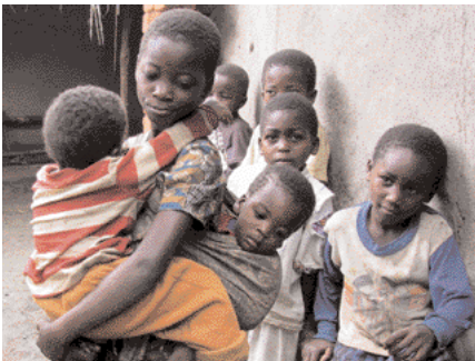
Stúlkur byrja ungar að taka ábyrgð á yngri systkinum.