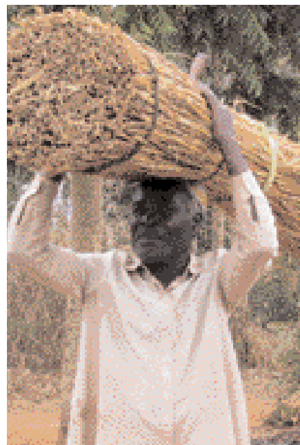
Með byggingarefni á höfðinu.