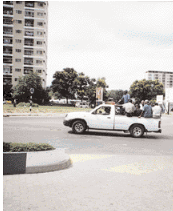
Fólksflutningar í Mapútó.

eftir að hafa misst annan fótinn við það að stíga á jarðsprengju. Enn eru jarðsprengjur víða í jörðu og minnir borgarastríðið þannig stöðugt á sig þótt nærri tíu ár séu liðin frá lokum þess.