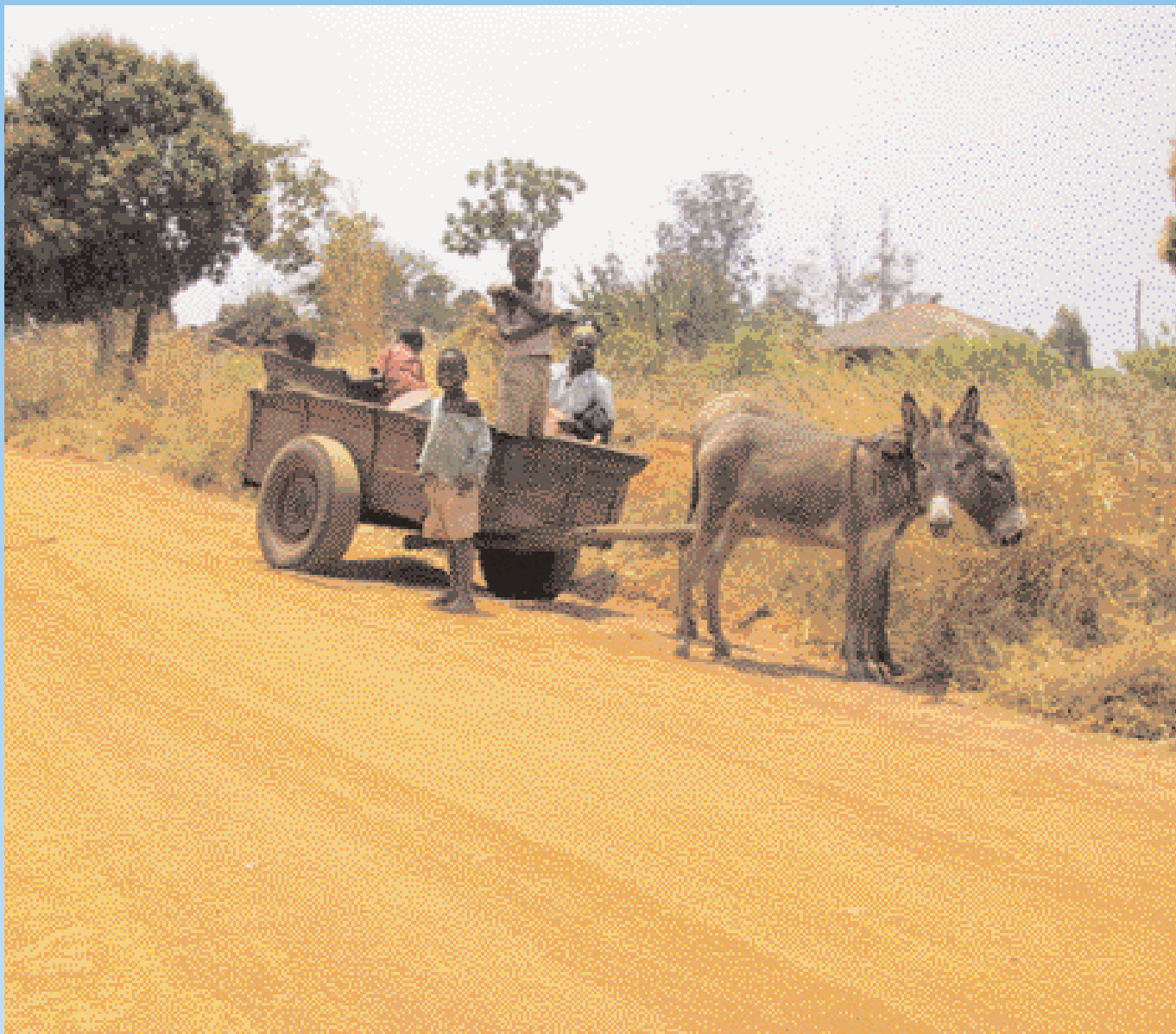
Algengur farkostur í Malaví.