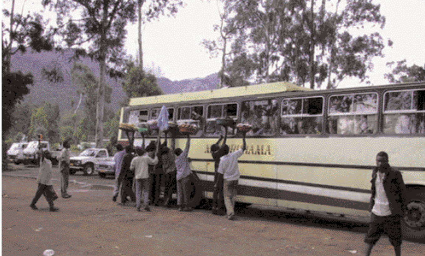
Sölmenn bjóða ferðalöngum varning sinn.