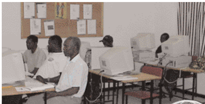
Nemendur tölvuskólans.