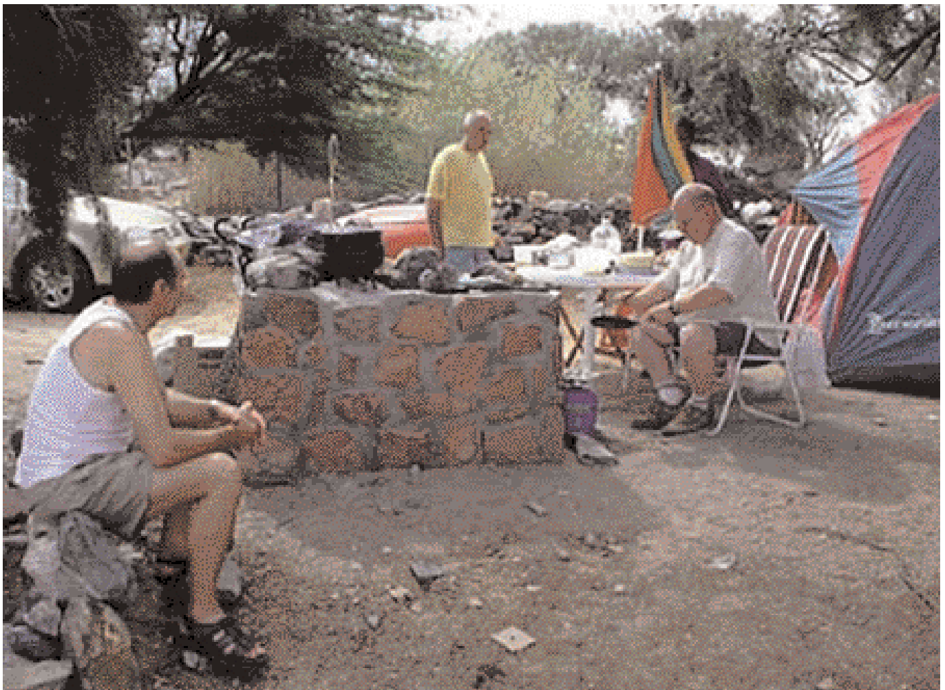
Bakaðar skonsur í útilegu.

Höfundur er búsettur í Walvis Bay í Namibíu á vegum PSSÍ.