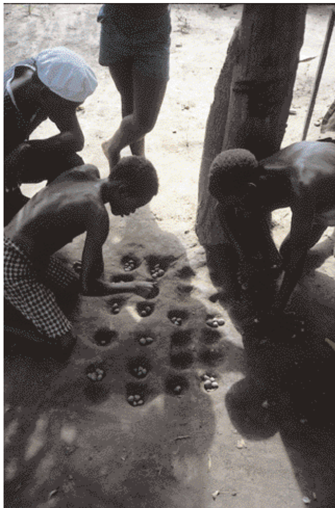
Spilað í sandinum.

Þessu var að við misstum besta vin okkar, allavega tímabundið, vegna heimsku og fordóma fullorðinna. Ég held að börn séu ekki fordómafull en þau eru fljót að læra það ef það er fyrir þeim haft.