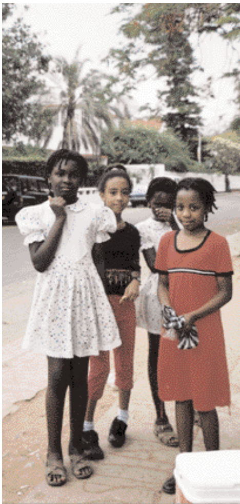
Skólastúlkur í miðborg Mapútó.