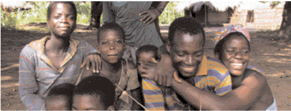
Glöð ungmenni í Apaflóa.